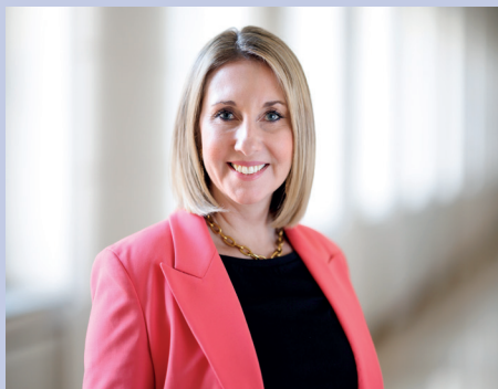
Anna Stolz, MdL Bayerische Staatsministerin für Unterricht und Kultus

Und gerade dadurch leistet der Schulsport einen wichtigen Beitrag zum Auftrag der Schulen, nicht nur Wissen zu vermitteln, sondern genauso auch die Persönlichkeit zu bilden sowie die Entwicklung von Sozialkompetenz und Gemeinschaft zu fördern.