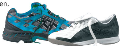
Joggingschuh / Universal-Hallen-Sportschuh

Man sollte sich beim Kauf also gut beraten lassen und die Möglichkeit nutzen, qualitativ hochwertige Auslaufmodelle preisgünstig zu erwerben.