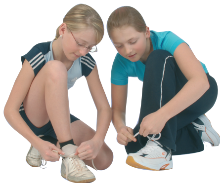
Ideal für den Sportunterricht: Universal-Hallen-Sportschuh (Schulsportschuh)

Sportschuhe, die man im Sportunterricht in der Halle trägt, sollen nicht auf der Straße getragen werden. Sie bringen sonst Schmutz in die Sporthalle, erhöhen dadurch das Unfallrisiko (Rutschgefahr) und die Gefahr der Verbreitung von Krankheitserregern. Wird der Hallensportschuh im Freien benützt, ist vor der weiteren Nutzung in der Sporthalle eine gründliche Reinigung des Schuhs erforderlich.